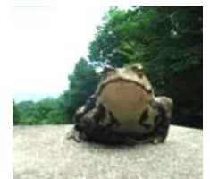
アズマヒキガエル